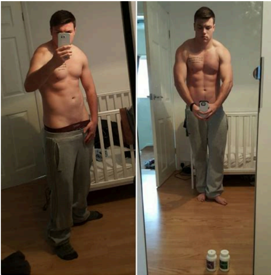
Winstrol oral XT GOLD

25mg x 100 tabletas stanoplex (Stano Ultra 25) $ 1,690.00 $ 1,090.00. Winstrol oral, olvídate de las inyecciones diarias de winstrol, con Winstrol oral 25 mg de XT GOLD los ciclos de definición serán mas cómodos que nunca, con las Tabletass de Winstrol comprimidos (stano ultra 25) conseguirás el Físico marcado y. look at here